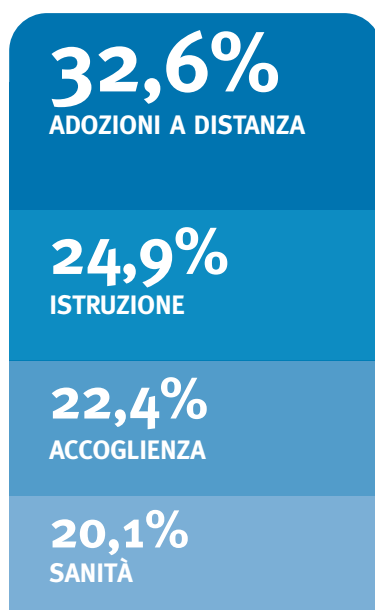
Distribuzione dei fondi erogati per tipologia di progetto