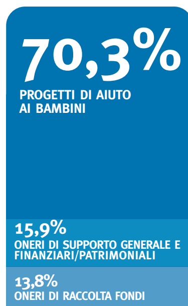
Destinazione dei fondi raccolti